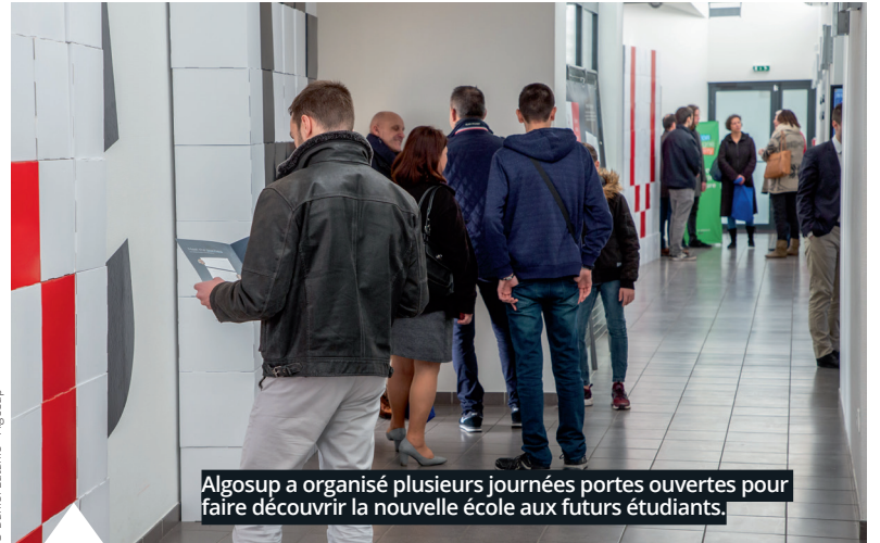
Algosup a organisé plusieurs journées portes ouvertes pour faire découvrir la nouvelle école aux futurs étudiants.