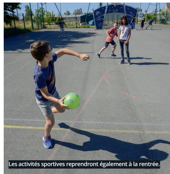
Les activités sportives reprendront également à la rentrée.

L'école de Tunnel-Château sera également l'une des trois écoles dans laquelle sera déployé le plan numérique avec les écoles Bourgneuf, rénovée en 2019 et Fay B, rénovée en 2018. « Câblage informatique, tableau blanc et vidéo projecteur interactif dans chaque classe élémentaire, ordinateur portable par classe à disposition des élèves, tablettes pour utiliser de nouvelles applications », liste Guillaume Renard du service informatique en charge de ce projet. Une demande de subvention a été lancée pour ce projet, le coût global s'élève à