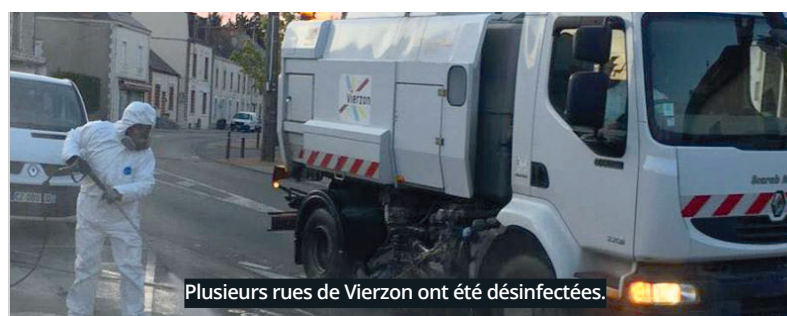
Plusieurs rues de Vierzon ont été désinfectées.