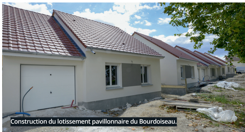
Construction du lotissement pavillonnaire du Bourdoiseau.

Découvrez quels sont vos élus référents sur le stand de la foire. Toutes les dates de visite seront communiquées à la foire et mises en ligne sur le site de la ville : www.ville-vierzon.fr