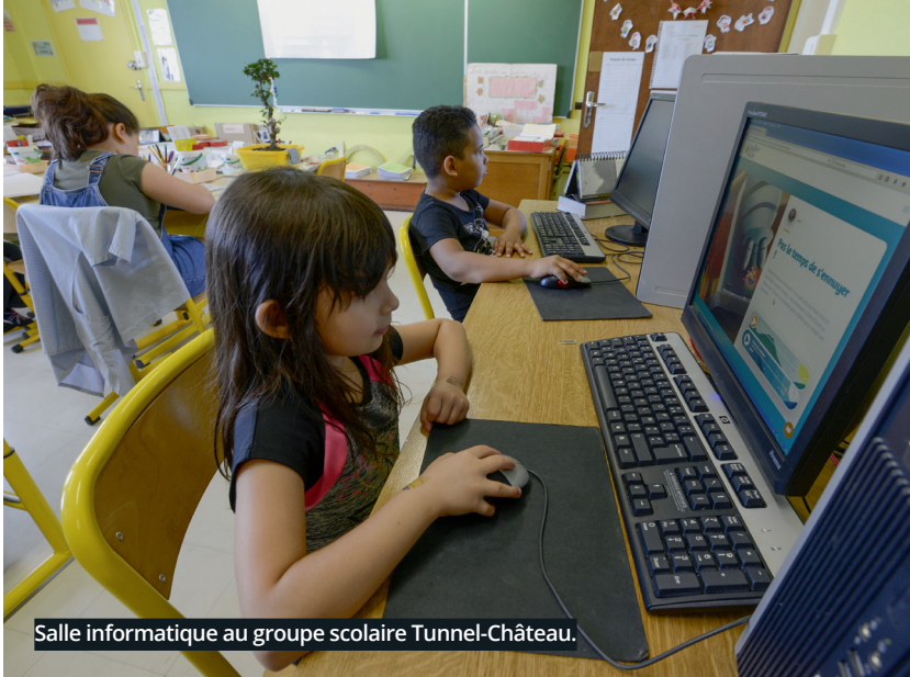
Salle informatique au groupe scolaire Tunnel-Château.