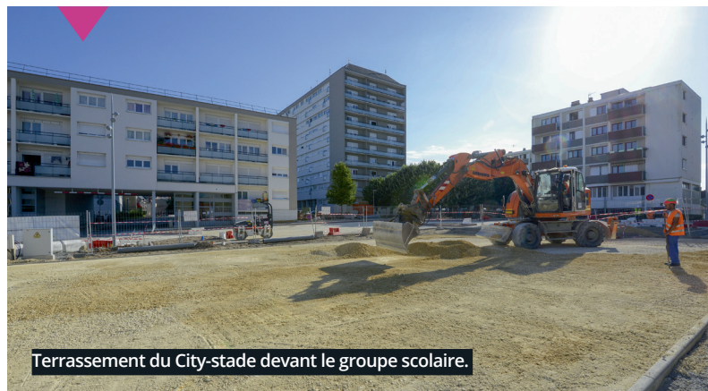
Terrassement du City-stade devant le groupe scolaire.