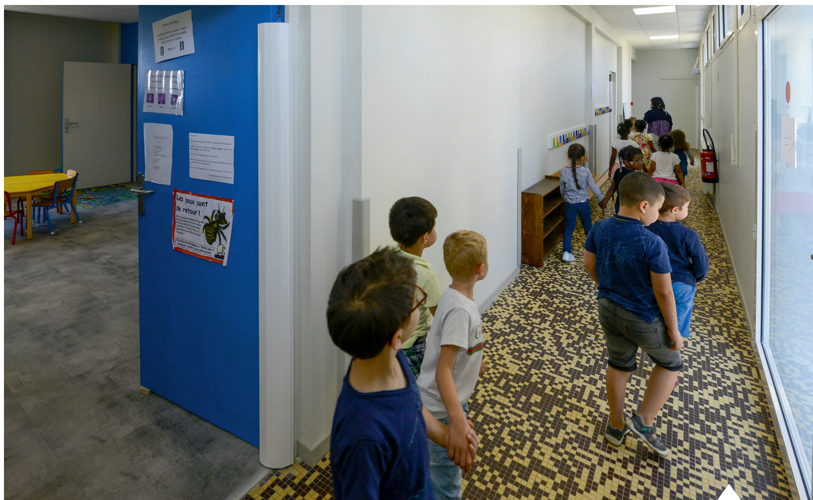
L'école du Tunnel-Château est en cours de réhabilitation, elle sera entièrement terminée à l'automne.